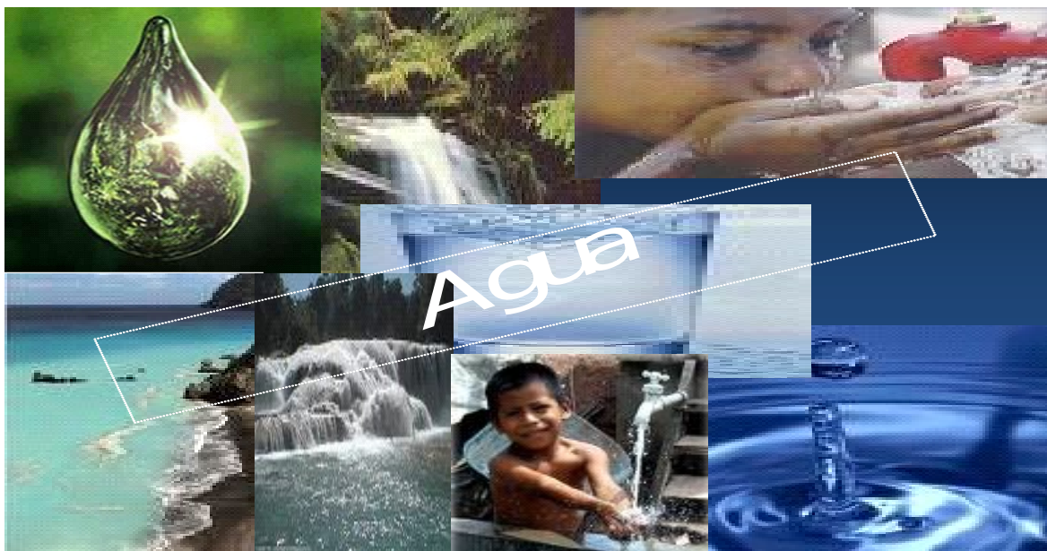
Presentación Seminario de Educación Ambiental. Matagalpa.2007

Tenemos claro que es necesario regular el uso del recurso y que se deben autorizar algunas licencias a las empresas que usan el agua por una cuestión de industria, pero, para entregar esas autorizaciones debe haber un estudio previo de impacto ambiental y se tiene que respetar el derecho de los pueblos indígenas a sus territorios y sus recursos.