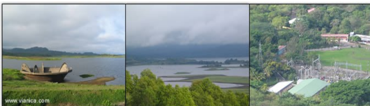
El lago de Apanás es el principal proveedor de energía hidroeléctrica de Nicaragua

Actualmente, la política de precios de la energía eléctrica no ha estimulado la utilización nacional de los recursos energéticos. Tiene que haber un clima favorable para la inversión en geotermia, energía solar, eólica e hidráulica.